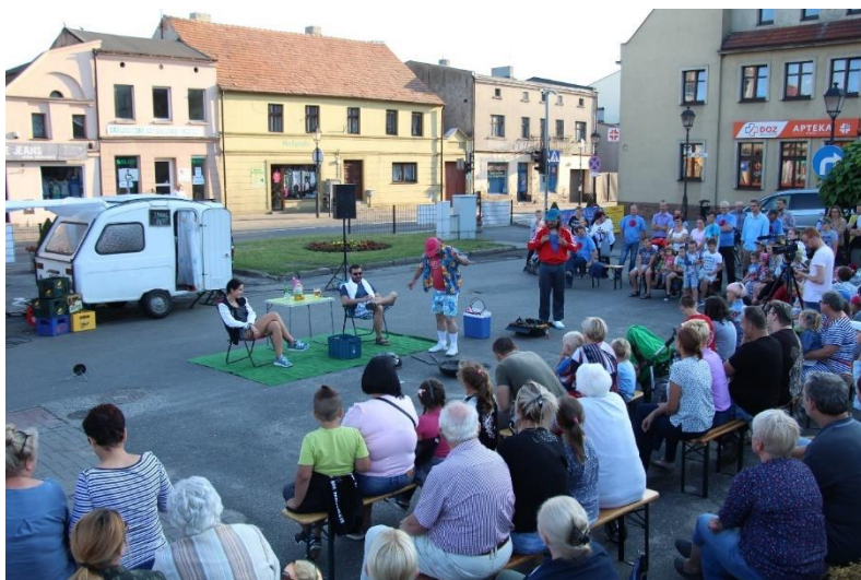
Rynek w Kostrzynie – „Malinowe Lato 2018”

Wydarzenia kulturalne nierozzerwalnie łączą się z promocją Gminy. Poprzez politykę informacyjną wiadomość o nich dociera do szerokiego grona odbiorców także poza granicami Gminy. Świadczy o tym duża frekwencja podczas największych koncertów, a także towarzyszącym imprezom biegowym. Gmina Kostrzyn w 2018 r. wykorzystywała w tym celu środki masowego przekazu – programy w telewizji STK, spoty reklamowe w Radiu Złote Przeboje, Radiu Pogoda i Melo Radio. Ponadto informacja o wydarzeniach pojawia się na monitorach w wagonach PKP.