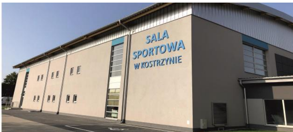
Sala sportowa przy Szkole Podstawowej Nr 1 w Kostrzynie

Wydatki inwestycyjne wiązały się z oddaniem do użytku hali sportowej przy Szkole Podstawowej nr 1 w Kostrzynie, boiska wielofunkcyjnego w Czerlejnii, dokonano termomodernizacji budynku klubowego na Stadionie Miejskim, wyposażono boisko wielofunkcyjne w Brzeźnie w szatnie, salę sportową w Siekierkach doposażono w kosze do koszykówki dla najmłodszych uczniów.