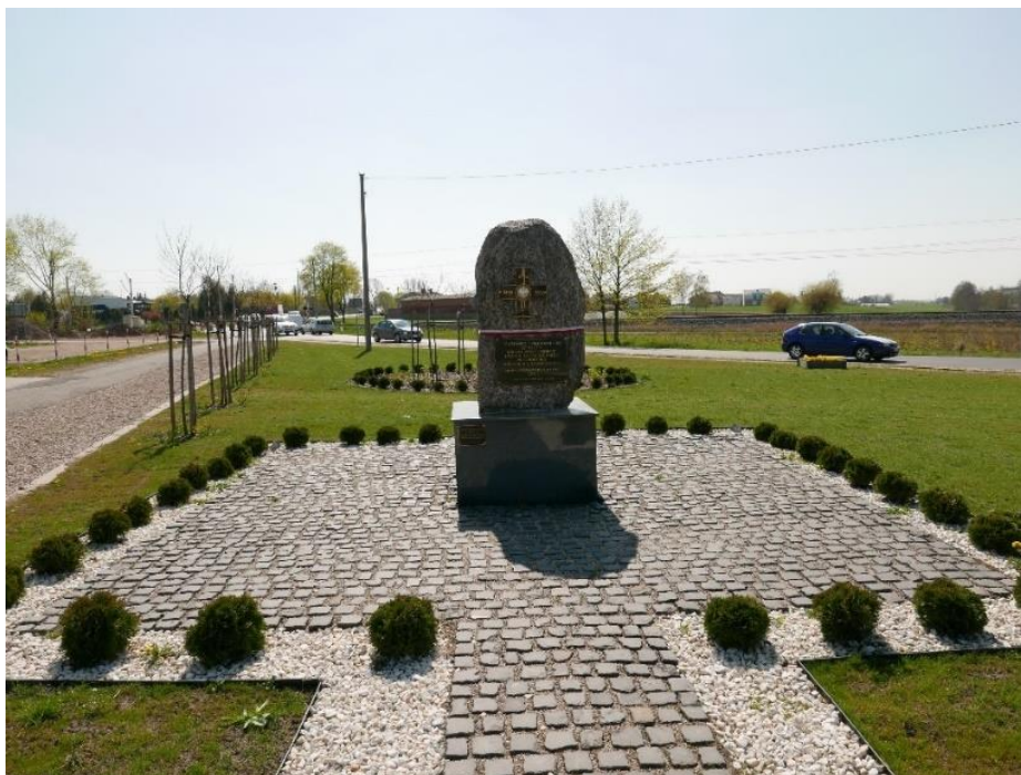
Pomnik Powstańców Wielkopolskich w Kostrzynie