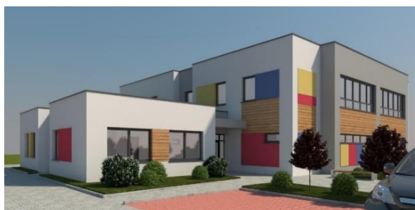
Wizualizacja budowanego Przedszkola przy ul. Powstańców Wlkp. w Kostrzynie

W czerwcu 2018 r. ogłoszony został pisemny przetarg ograniczony do podmiotów prowadzących działalność oświatową, na oddanie w dzierżawę nieruchomości niezabudowanej, położonej w Kostrzynie przy ul. Powstańców Wielkopolskich, stanowiącej własność Gminy Kostrzyn, w celu wybudowania budynku i prowadzenia w nim działalności oświatowej: przedszkola publicznego. W wyniku zakończonej procedury wyłoniony został podmiot, z którym podpisana została umowa na wybudowanie powyższego obiektu, który swoją działalność rozpocznie 1 września 2020 r.