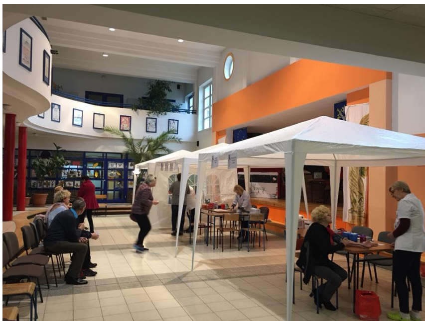
Szkoła Podstawowa Nr 2 w Kostrzynie - „Sobota dla zdrowia 2018”

W ramach akcji prozdrowotnej odbył się także wykład edukacyjny, dotyczący chorób skóry oraz profilaktyki czerniaka. Mieszkańcy mieli możliwość zbadania znamion. Akcja „Sobota dla zdrowia” jest przygotowywana we współpracy z lokalnymi placówkami medycznymi: Przychodnią Lekarza Rodzinnego „Sanus”, Centrum Medycyny Rodzinnej „Kamed”, Poradnią Lekarza Rodzinnego w Gułtowach oraz PCK Kostrzyn.