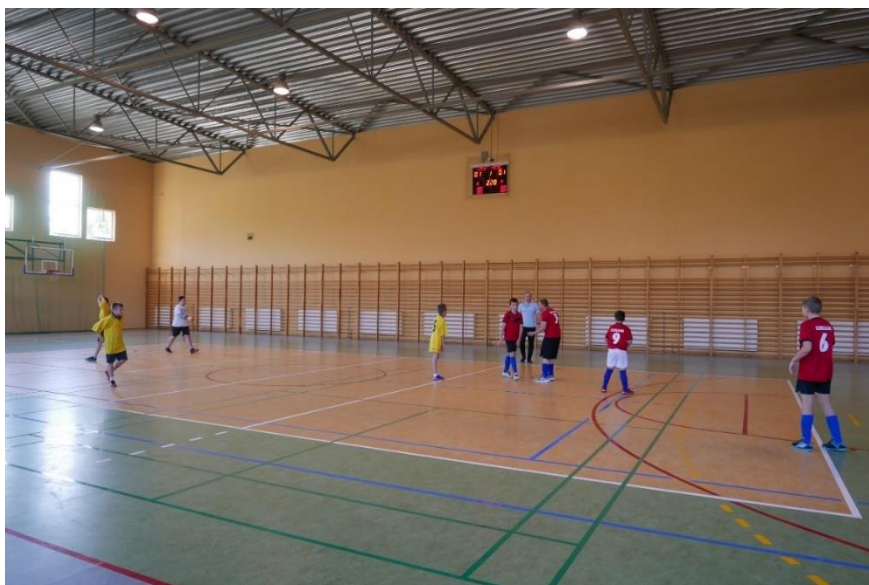
Sala sportowa przy Szkole Podstawowej w Gultowach

W Szkole Podstawowej w Iwnie wykonany został remont korytarzy szkolnych, sali gimnastycznej oraz zmodernizowana została sieć komputerowa. W Szkole Podstawowej w Siekierkach dokonano drobnych napraw instalacji elektrycznej. Łączna wartość wykonanych remontów to 823 216,85 zł.