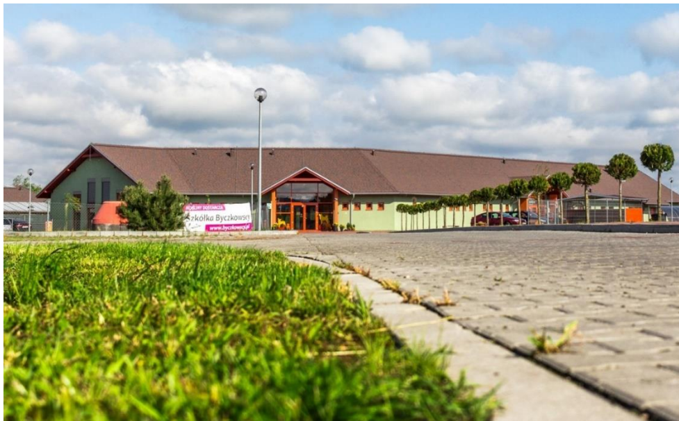
Schronisko dla zwierząt w Skalowie

Program określa również plan znakowania zwierząt w Gminie polegający na znakowaniu psów należących do Mieszkańców Gminy przez wszczepienie pod skórę psa elektronicznego mikroprocesora.