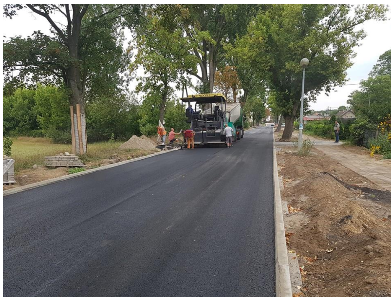
ul. Ułańskiej w Iwnie