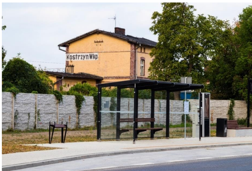
ul. Warszawska w Kostrzynie

W 2018 r. zrealizowano zadanie polegające na budowie zintegrowanego węzła przesiadkowego w Kostrzynie. Węzeł przesiadkowy zlokalizowany w rejonie dworca kolejowego to parkingi Park&Ride (106 miejsc) oraz Bike&Ride (20 stanowisk) w ciągu ulicy Warszawskiej i Ogrodowej. W ramach inwestycji zakupiono także 4 niskoemisyjne autobusy i uruchomiono komunikację publiczną na terenie Gminy Kostrzyn.