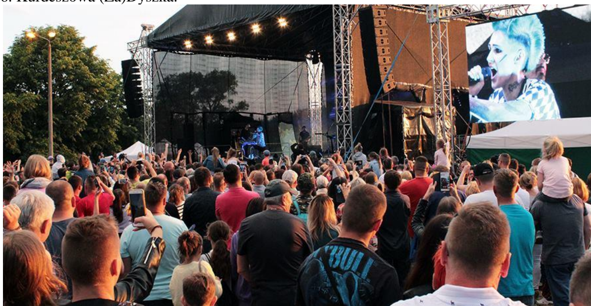
Kurdesz Kasztelański 2018

Tradycyjnie w maju Gmina Kostrzyn obchodzi swoje kulturalne święto Kurdesz Kasztelański. W tym roku przypadało jego 40-lecie. Gmina celebrowała to wydarzenie przez trzy dni. Początkowo odbył się konkurs o charakterze wspominkowym, w którym zmierzyły się dwie drużyny: samorządowcy kontra mieszkańcy. Wystąpiła też gwiazda disco polo Teresa Werner. W sobotę na Rynku w Kostrzynie zorganizowano wystawę samochodów zabytkowych. W nawiązaniu do pierwszych edycji Kurdesza Kasztelańskiego, ulicami miasta przeszedł barwny korowód przebierańców. Podczas dwóch kolejnych dni wystąpiły na kostrzyńskiej scenie gwiazdy muzyki: Margaret, Norbi, Agnieszka Chylińska, Piękni i Młodzi, Shaun Baker i Jessica Jean oraz Wind Cameral Orchestra. Tradycyjnie w tych dniach odbyły się dwa biegi – dla dzieci Mini Kurdeszowa (Za)Dyszka oraz bieg na 5 i 10 km 6. Kurdeszowa (Za)Dyszka.