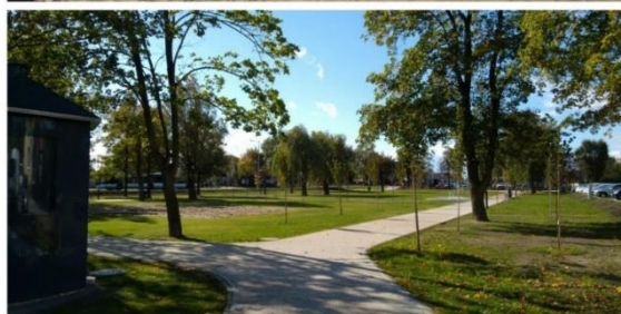
Park Miejski w Kostrzynie