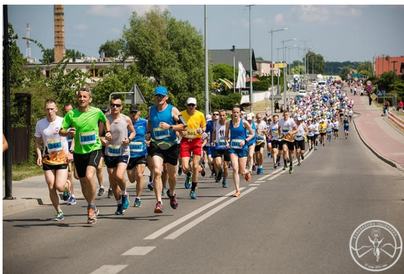
Bieg VI Kurdeszowa (Za)Dyszka 2018

W ramach zadań dotyczących sportu Gmina Kostrzyn przyjęła „Roczny Program Współpracy Gminy Kostrzyn z Organizacjami Pozarządowymi oraz podmiotami, o których mowa w art. 3 ust. 3 ustawy z dnia 24 kwietnia 2003 r. o działalności pożytku publicznego i o wolontariacie na 2018. Ponadto pomogła w organizacji imprez sportowych w zakresie sportu szkolnego, organizowano eliminacje gminne w ramach dyscyplin sportowych objętych XIX Igrzyskami Dzieci i Młodzieży Powiatu Poznańskiego, realizowano programy „Umiem Pływać” i „Szkolny Klub Sportowy”, Czwartki Lekkoatletyczne, a także współorganizowano III Bieg Charytatywny w Wiktorowie oraz Olimpiadę Przedszkolaka. Co więcej, Gmina Kostrzyn organizowała wydarzenia sportowe takie jak VI Kurdeszowa (Za)Dyszka, Mini Kurdeszowa (Za)Dyszka, VII edycję Kostrzyńskiej Ligi Nocnych Marków, Turniej Piłki Siatkowej z okazji Dnia Niepodległości. Dokonano także wyboru ofert sportowych w zakresie prowadzenia Uczniowskich Klubów Sportowych oraz ofert innych klubów sportowych i organizacji pozarządowych, przeprowadzonych w ramach otwartego konkursu ofert na realizację zadań publicznych w 2018 r. mających na celu organizację cyklicznych treningów oraz imprez sportowych dla Mieszkańców w różnych dyscyplinach sportowych. Wspierano również inne inicjatywy oddolne oraz organizacje pozarządowe w ich działalności poza trybem konkursowym.