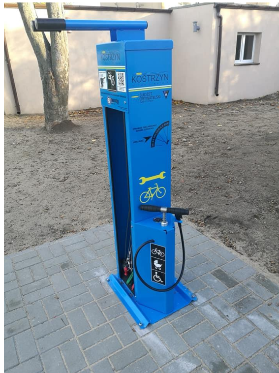
Samoobsługowe stacje naprawy rowerów

W ramach zadania zostały zakupione i zamontowane samoobsługowe stacje naprawy rowerów na ścieżkach rowerowych oraz miejscach z dużym natężeniem ruchu rowerowego w Gminie Kostrzyn. W Kostrzynie stacje znajdują się w parku Harcerza, parku Miejskim, na boisku Orlik, ul. Krzywoustego, ul. Okrężnej, w Gminie przy Szkołach Podstawowych w miejscowościach: Gułtowy, Iwno, Siekierki, Brzeźno, Czerlejno oraz przy świetlicy w Wiktorowie. Stacje rowerowe są wyposażone w następujące przyrządy: wkrętak krzyżowy, wkrętak płaski, wkrętak TORX T25, klucz nastawny, klucz płaski 8x10 mm, klucz płaski 13x15 mm, zestaw imbusów w rękojeści 2-8 mm, łyżki do opon, pompka z adapterem na wszystkie zawory, zestaw montażowy (4 x kotwy M10, 80 mm), śruby zabezpieczające z grotami.