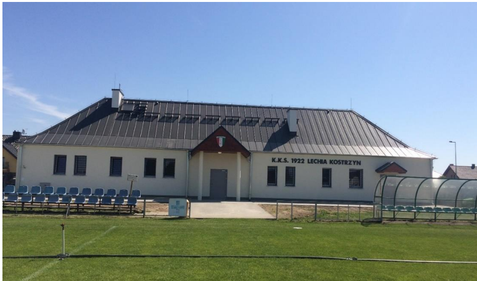
Stadion Miejski w Kostrzynie