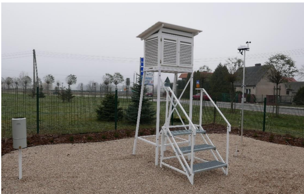
Stacja meteorologiczna w przy Szkole Podstawowej nr 2 Kostrzynie

W ramach uzyskanego wsparcia finansowego z Wojewódzkiego Funduszu Ochrony Środowiska i Gospodarki Wodnej w Poznaniu przy Szkole Podstawowej nr 2 w Kostrzynie w listopadzie 2018 r. powstała stacja meteorologiczna w ramach projektu pn. „Przyszkolny ogródek dydaktyczny – stacja meteorologiczna w Kostrzynie” (koszt realizacji 24 951,00 zł, z czego dofinansowanie wynosiło 21 268,00 zł).