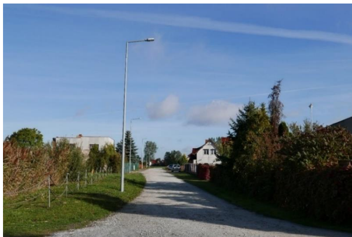
Oświetlenie uliczne przy ul. Osiedlowej w Czerlejni