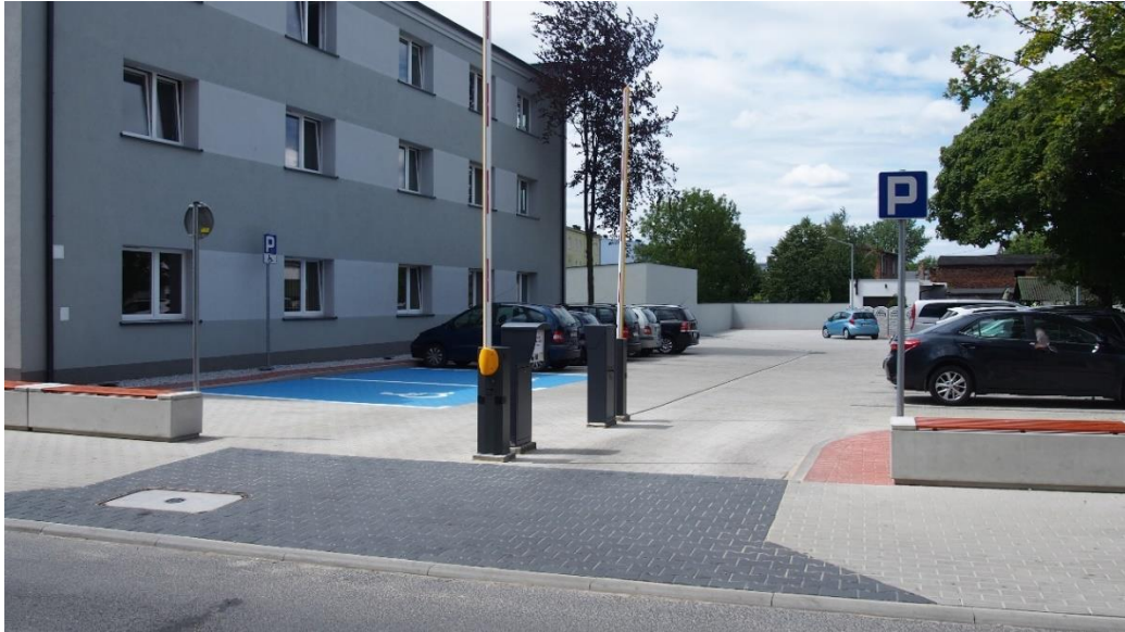
Parking przy ul. Dworcowej w Kostrzynie