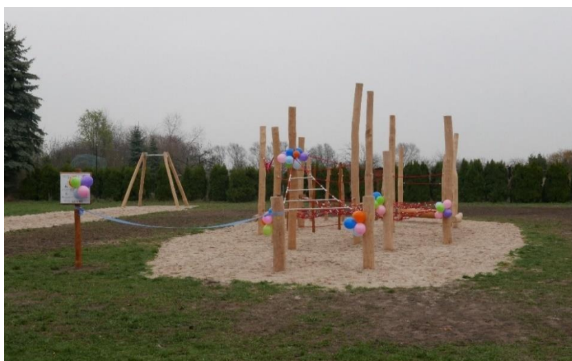
Parki linowy przy Szkole Podstawowej w Czerlejniewie

Dodatkowo zakupione zostały 4 tablice interaktywne i 2 projektory ultra krótkoogniskowe jako wyposażenie szkoły w Czerlejniewie.