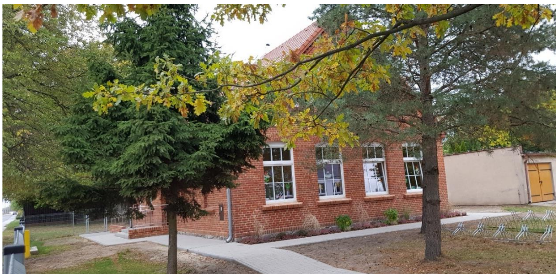
Świetlica w Siekierkach Wielkich

Wykonywane są niezbędne remonty i rozbudowy. W 2017 r. zakończona została rozbudowa i remont Szkoły Podstawowej w Siekierkach Wielkich, a w 2018 r. kontynuowane były działania zmierzające do dostosowania placówki do dynamicznego wzrostu liczby uczniów, wykonano kompleksową modernizację energetyczną świetlicy.