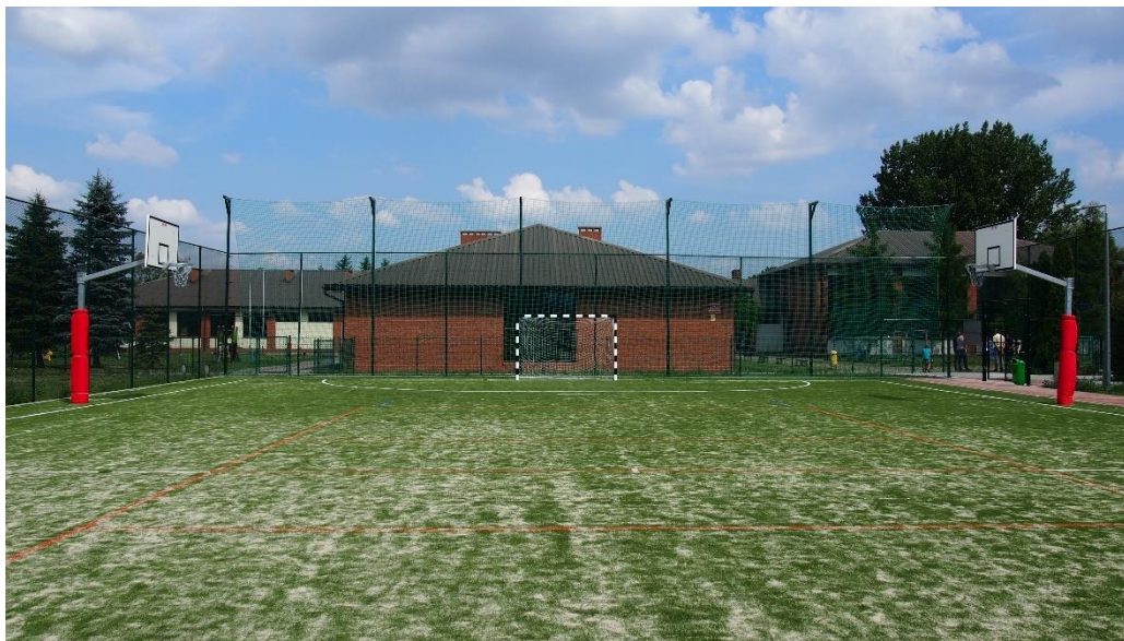
Boisko wielofunkcyjne przy Szkole Podstawowej w Czerlejnii

Mając na celu godny rozwój młodych sportowców z terenu Gminy Kostrzyn przyznano stypendia sportowe w kwocie 33 600,00 zł.