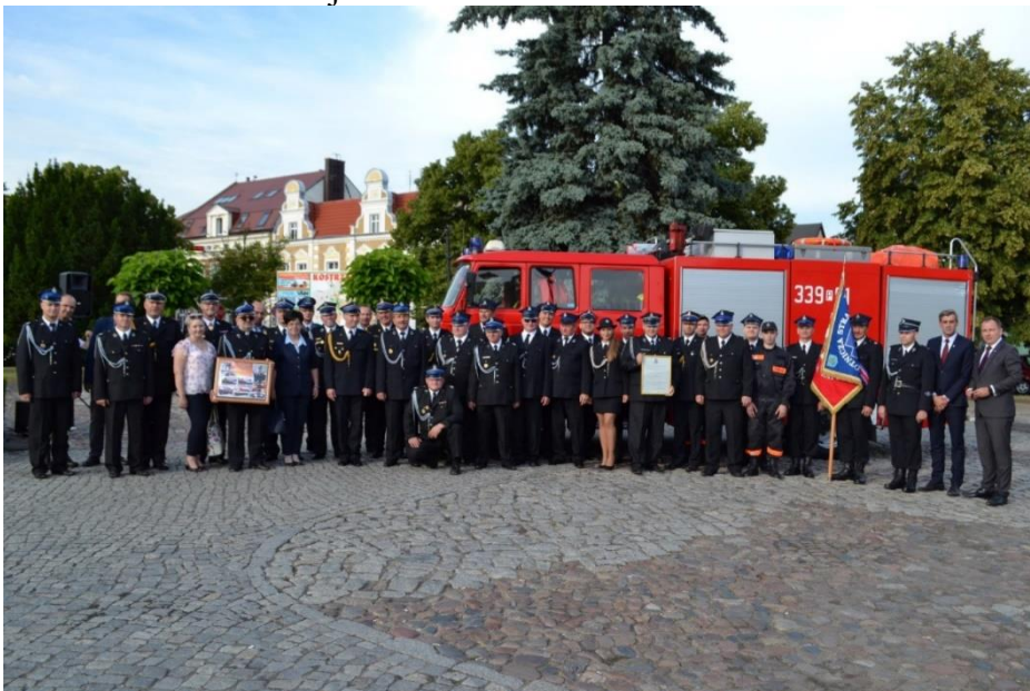
Rynek w Kostrzynie: uroczystość włączenia jednostki OSP w Brzeźnie do KSRG

W czerwcu 2018 r. jednostka OSP w Brzeźnie została włączona do Krajowego Systemu Ratownictwa Gaśniczego, co było poprzedzone doposażeniem jednostki w niezbędny sprzęt ratowniczo-gaśniczy. Do dyspozycji jednostek OSP Gminy Kostrzyn pozostaje 6 wozów pożarniczych. W 2018 r. pozyskano środki z Ministerstwa Sprawiedliwości w kwocie 31 512,00 zł z przeznaczeniem na zakup sprzętu ratowniczo-gaśniczego jak: defibrylatory, zestaw ratownictwa medycznego, detektory wielogazowe czy sprzęt do oznakowania terenu akcji.