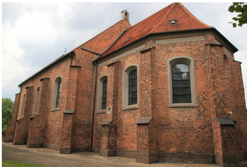
Fot. 1 Kościół pw. Św. Apostołów Piotra i Pawła w Kostrzynie