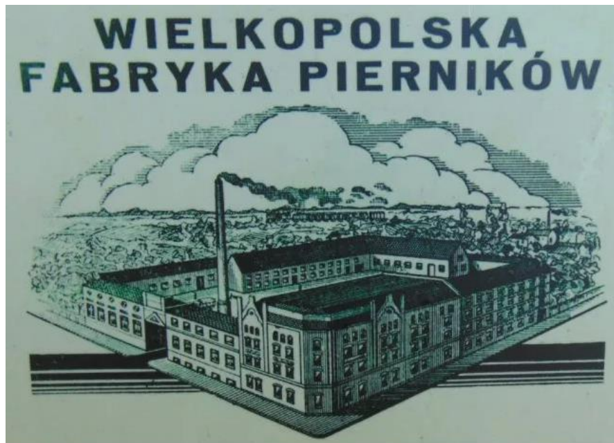
Fot. 3 Rysunek przedstawiający fabrykę pierników i makaronu, I połowa XX w.

W krzewieniu kultury i walki o polskość znaczną rolę odegrały Koło Śpiewackie, Towarzystwo Gimnastyczne „Sokół” oraz Towarzystwo Czytelni Ludowych. W 1906 r. dzieci szkolne strajkowały w obronie języka polskiego. Podczas powstania wielkopolskiego 1918/1919 Kostrzyn zorganizował kompanię oraz pluton powstańczy, które wzięły udział w walkach pod Zbąszyniem i Kcynią. W okresie międzywojennym miasto rozwijało się wolno. W czasie okupacji niemieckiej miały tu miejsce liczne aresztowania i egzekucje. 20 października 1939 r. żandarmeria rozstrzelała 28 obywateli Kostrzyna i okolic. Ponad 40 kostrzynian zginęło w więzieniach i obozach, ok. 300 wysiedlono do Generalnej Guberni. Od 1941 r. działała tu komórka tajnej organizacji, która później podporządkowała się Armii Krajowej. W obawie przed nadciągającą ofensywą wojsk radzieckich, które wkroczyły do Kostrzyna 22 stycznia 1945 r. prawie wszyscy Niemcy uciekli z miasta.