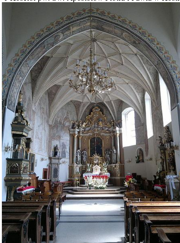
Fot. 2 Wnętrze kościoła farnego w Kostrzynie