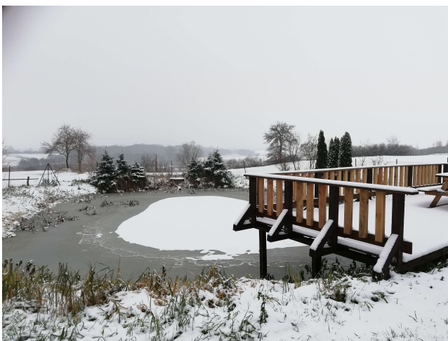
4. Teren rekreacji – taras widokowy