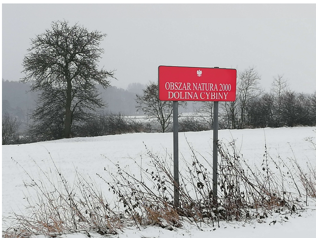
3. Dolina Cybiny