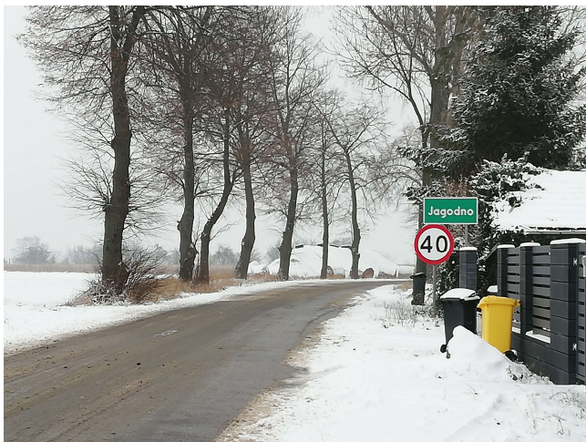
1. Droga gminna