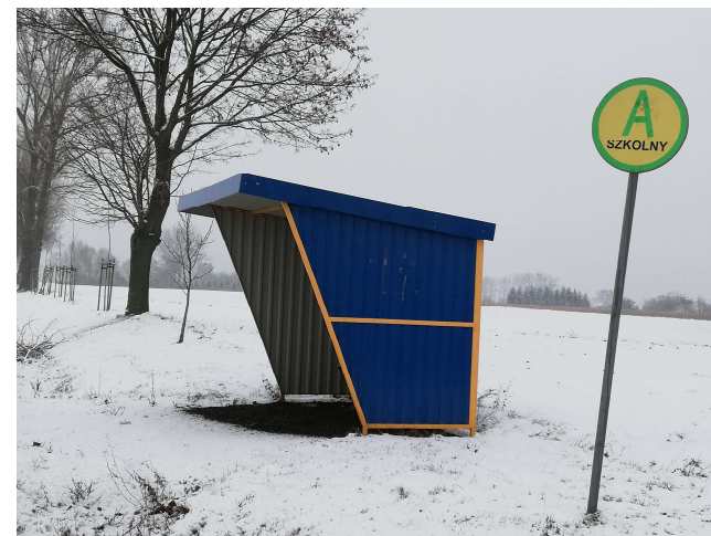
2. Przystanek szkolny przy drodze powiatowej