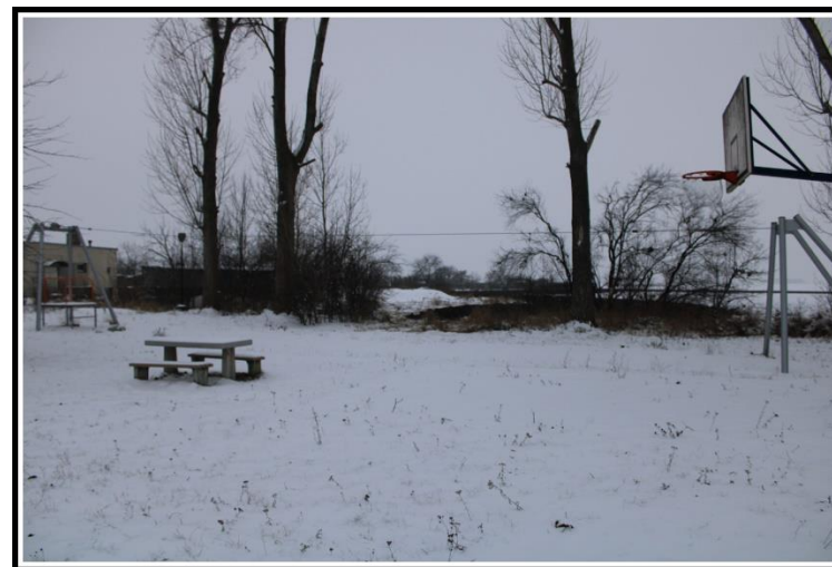
Boisko do piłki nożnej, boisko do koszykówki