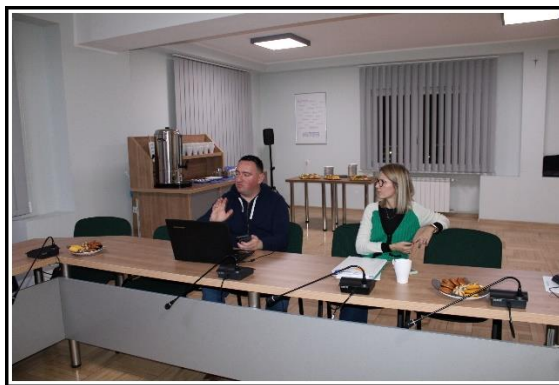
Warsztaty z budowania Soleckiej Strategii Rozwoju Wsi, 17-18 grudnia 2021 r. Urząd Miejski w Kostrzynie