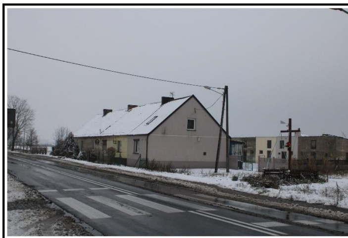
Główna droga w solectwie