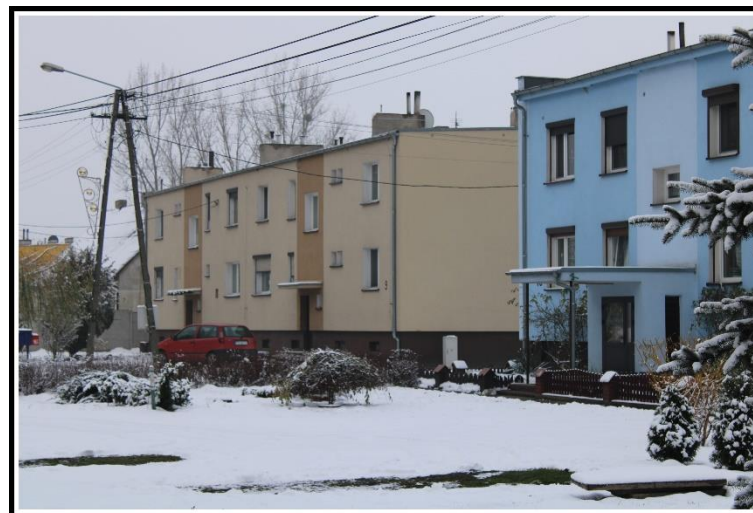
Bloki mieszkalne w solectwie