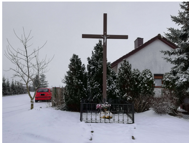
2. Krzyż przydrożny