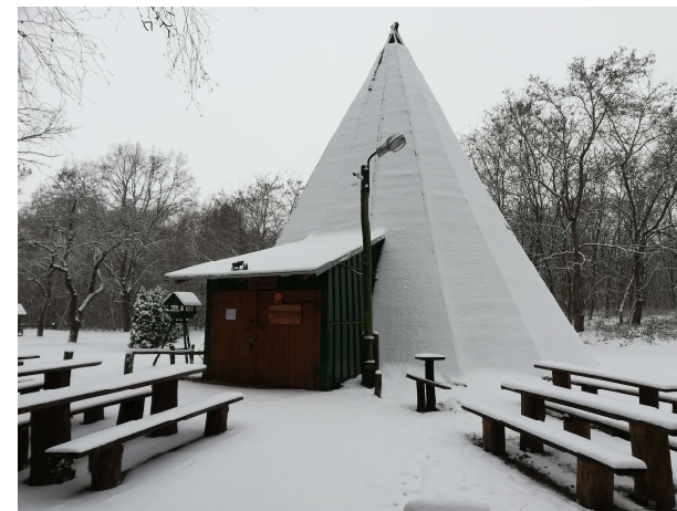
3. Stanica myśliwska