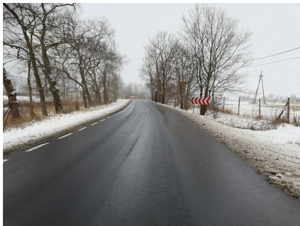
1. Droga powiatowa