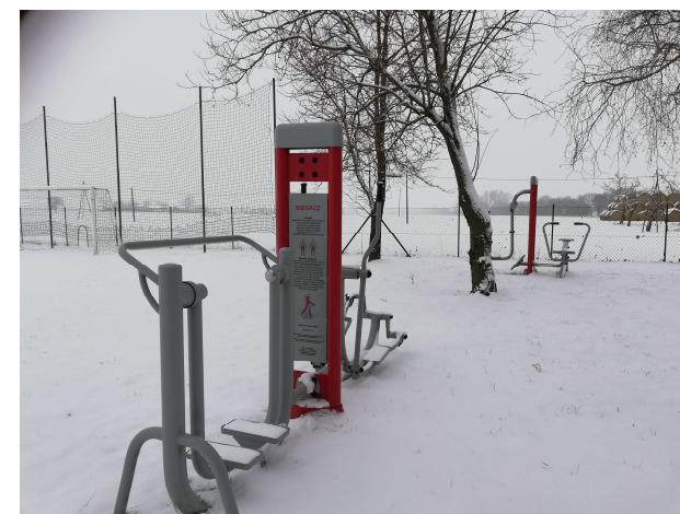
4. Teren rekreacji (miejsce pod ognisko, plac zabaw, siłownia, boisko)